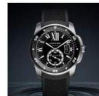
Cartier scommette sull'uomo con il Diver