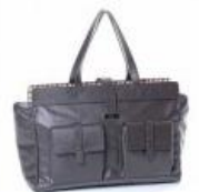
Borbone per Daks, ecco la prima collezione